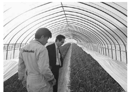
3月25日 知内町内調査