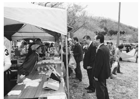
5月19日 熊石あわびの里フェスティバル