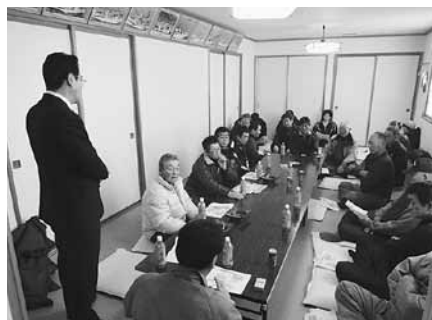
2月23日 松前町茂草地区懇談会