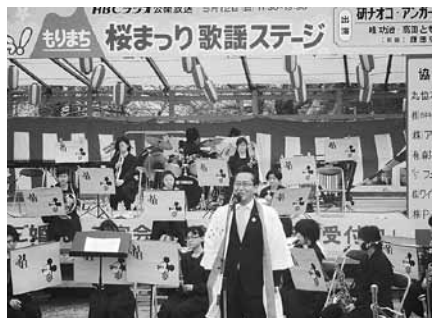
5月3日 もりまち桜まつり