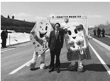
3月27日 鹿部道路開通式